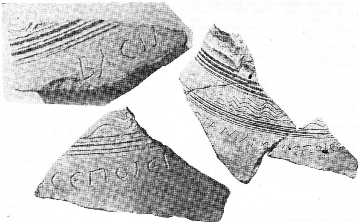
Fig. 1. Ocnîța—Buridava. Fragmente ceramice cu inscripții.